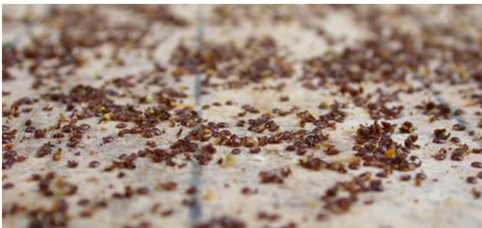
14. September 2006, das Kontrollvolk nach der Ameisensäurebehandlung mit 2 830 Milben.

Im Sommer 2006 hat sich Volk 5 über einen Schwarm geteilt. Dieser Schwarm wurde gefangen, einlogiert und ebenfalls weiter beobachtet. Sowohl im Restvolk als auch im Schwarm waren 11 500 Bienen. Welcher Volksteil hat die grösseren Überlebenschancen? Das abgeschwärmte Volk oder der Schwarm (Tabelle 3)? Das Muttervolk trug erwartungsgemäss die weit grössere Milbenlast in der Brut, wie der Milbentotenfall in den folgenden Monaten Juni und Juli zeigte. Doch die grosse Milbenbelastung kann noch in der Vegetationsperiode abgebaut werden und damit steigt die Überlebenschance des Volkes. Der Schwarm hingegen konnte seine vorteilhafte Ausgangslage nicht nutzen, im August und September vermehrte sich seine Varroapopulation zu einer tödlichen Fracht. Die volkseigenen Abwehrmechanismen wirkten nicht mehr. Die Bienen verliessen den Stock und anfangs November war der Schwarm auf 20 Bienen mit Königin zusammengeschrumpft. Auch bei den Gotlandversuchen war festgestellt worden, dass Schwärme geringere Überlebenschancen haben als Muttervölker.